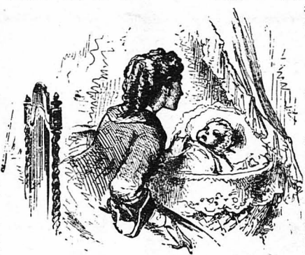
Εἶδε τὴ γυναῖκα του καθισμένη πλάι στὴν κούνια τοῦ παιδιοῦ τους, νὰ τὸ κνιτάξῃ μὲ λατρεία...

Ὁ πόνος τὴν εἶχε κάνει ἀγνώριστη. Ἄπ' τὸ στόμα της ἔβγα-