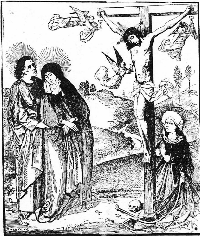
'Επί του Σταυρού. (Σχολή Κολώνιας—Μουσείον Κολωνίας)

Μπρός στον Φειδία είχα γονα- (τίσα, είδα τόν 'Ιλισό ν' άνθοβολή, ξήτησα του 'Υμητού κάθε με- (λίσι. 'Εκει ποθώ νά ξεφυγίσω, έκει. 'Ο ήλιος αυτός τά βάθη τής ψυ- (χής, Θέ μου, άς θεριάσει μόνο μάν (ήμέρα. 'Ο Θρασύβουλος είνε νικητής, ή λευτεριά φωνάζει από τή πέρα, 'Εμπρός, σαλεύει ή βάρκα νά (πετάξη, νά μη γαθώ σώσε με, κύμα, έσύ, στον Πειραιά τή λύρα άτε ν' (άραξη. 'Εκει ποθώ νά ξεφυγίσω, έκει, Είν' ό ούρανός τής 'Ιταλίας γλυ- (κός, άλλ' ή σαλαβιά τó χρομόμα του (θαλόνει. Λάμνε, κι' ό δρόμος είνε μαζου- (νός, ναύκληρε, λάμνε έκει πού ζημε- (ρώνει. Ποιό νάν' τó κύμα; Οί βράχοι (αυτοί οί μεγάλοι; Ποιόν ήλιο βλέπω εμπρός μου (νά φανή; 'Η τυραννία πεθαίνει στ' άκρο- (γάδι. 'Εκει ποθώ νά ξεφυγίσω, έκει. 'Αφήστε δώ ένας βάραβος νά (ρθή, παρθένες, στην καρδιά σας βάλ- (τε λάβα. Γι' αυτή τή χώρα άφίνα άσπλα- (χη γή έπαν τών θρόνων ή έμπνευσι είνε (σαλάβα.