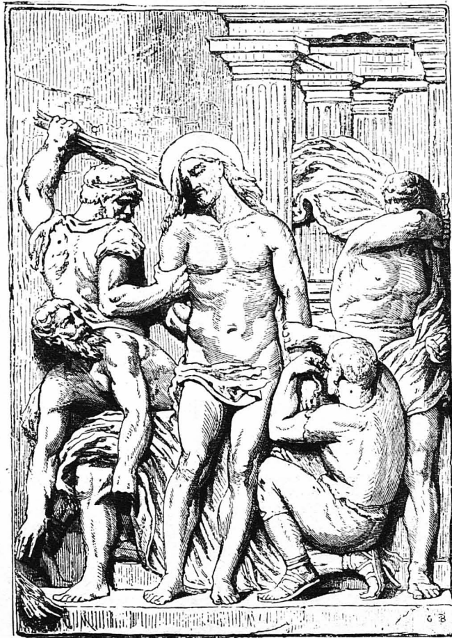
Ἡ Μαστιγώσις τοῦ Κυρίου. (Τοῦ Μαρκέτος—Μέγα Βραβεῖον Ρώμης)