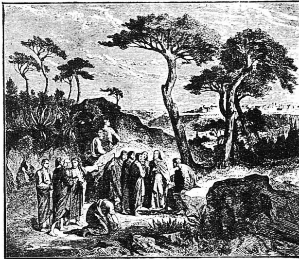
Ο Ίησους και οι μαθηταί του έξω από τό Ίεροσόλυμα.

«Ή περιπέτεια αυτή μου στοιχισε μιάς βδομάδος παραμονή στο κρεβάτι και την άναβολή φυσικά της παραστάσεως.