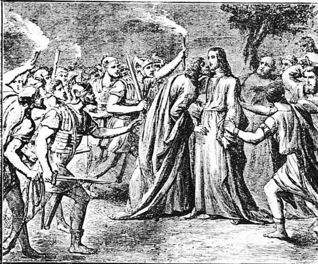
Το Φίλημα του 'Ιούδα.

Επίσης στον κηπο του βρισκόντουσαν όλα τα είδη των λουλουδιών και των ρόδων.