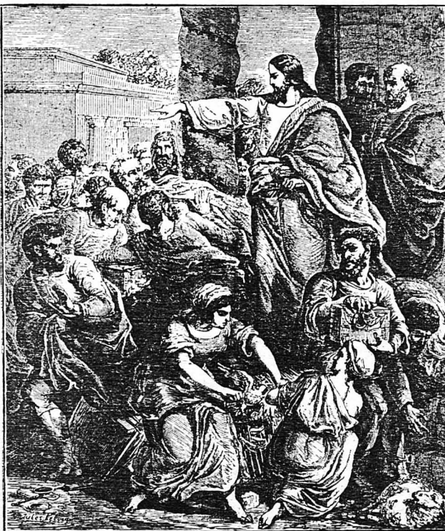
'Ο Ἰησοῦς διώχνει ἀπ' τὸ ναὸ τοὺς ἐμπόρους καὶ ἀργυραμοιβοὺς.

3 — Ποῦ πάει τ' ἀγαπημένο μου (τώρα τὸ βοᾶδν-βοᾶδν; — Στὴ βουσί πάω γιὰ χροῦ νερό, (στὸ ποταμὸ γιὰ πλύμα. — Σὰν πᾶς, 'Ελένη, γιὰ νερό, (στὸν ποταμὸ γιὰ πλύμα, πάρε κι' ἐμὲ τὰ ροῦχα μου, ποῦλι (μου, νὰ τὰ πλύνης. Νὰ μὴν τὰ πλύνης με νερό, οὔτε (καὶ μ' ἄλυσσιβα παρὰ μὲ μωσκοσάπουνο πού βάνεις (στὰ μαλλιά σου. Νὰ μὴν τ' ἀπλώσης σὲ δεντρί, οὐ- (τε σὲ κισσαρίσι παρὰ σὲ πιραμυγδαλιά στὰ κον- (τοκλώναρά της νὰ λέφτουν τ' ἄνθια ἀπάνω σου, (τὰ μῆλα στὴν ποδιά σου.