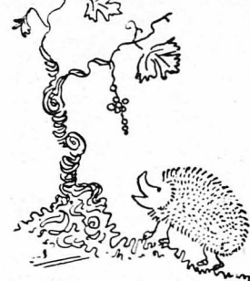
"Ένας σκαντζόχοιρος βγαίνει νά βοσκήσῃ...

"Ένα έρωτευμένο ζευγάρι πού ετόχησε νά πραγματοποιήσῃ τὸ ποιητικώτερο τῶν ονειρών του, τὴν έννοιά του καί μιά καλόθεα στήν έρμη, απολαμαίνει τώρα τὴν ονειρώδη αὐτὴ εὐτυχία τῶν έρωτευμένων. Ἡ σκηνή ὑποτίθεται σ' ἕνα έρμη μέρος τῆς Ἀτικῆς, ἀπάνω σὲ μιά βραχάτι, κοντὰ στίς Κουκουβάουες, ἐγκαταλειμμένη ἀπὸ τὸν βραχάτη κι' εἰτοιμόρροπη. Ἐρημιά καί ξεροιλιά βασιλεύει γύρω σ' ἀπόστασι ἀπέραντη, γιατί οἱ Νεοέλληνες ἔκοψαν κι' ἔκαψαν όλα τὰ δέντρα. Μιά γίδα βόσκει λίγο παραπέρα, προσπαθώντας ν' ἀνακαλύψῃ κανένα χορτάρι μέσα στὰ ξερά θυμάρια καί τὰ γαιθουράγκαθα. Τρεῖς ἀρουραῖοι τρυπάνουν στίς ὑπόγειες φωλιές τους κι' ένας σκαντζόχοιρος βγαίνει νά βοσκήσῃ.