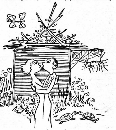
Φιλιούνται ἐπὶ δυόμιση ὥρες!...