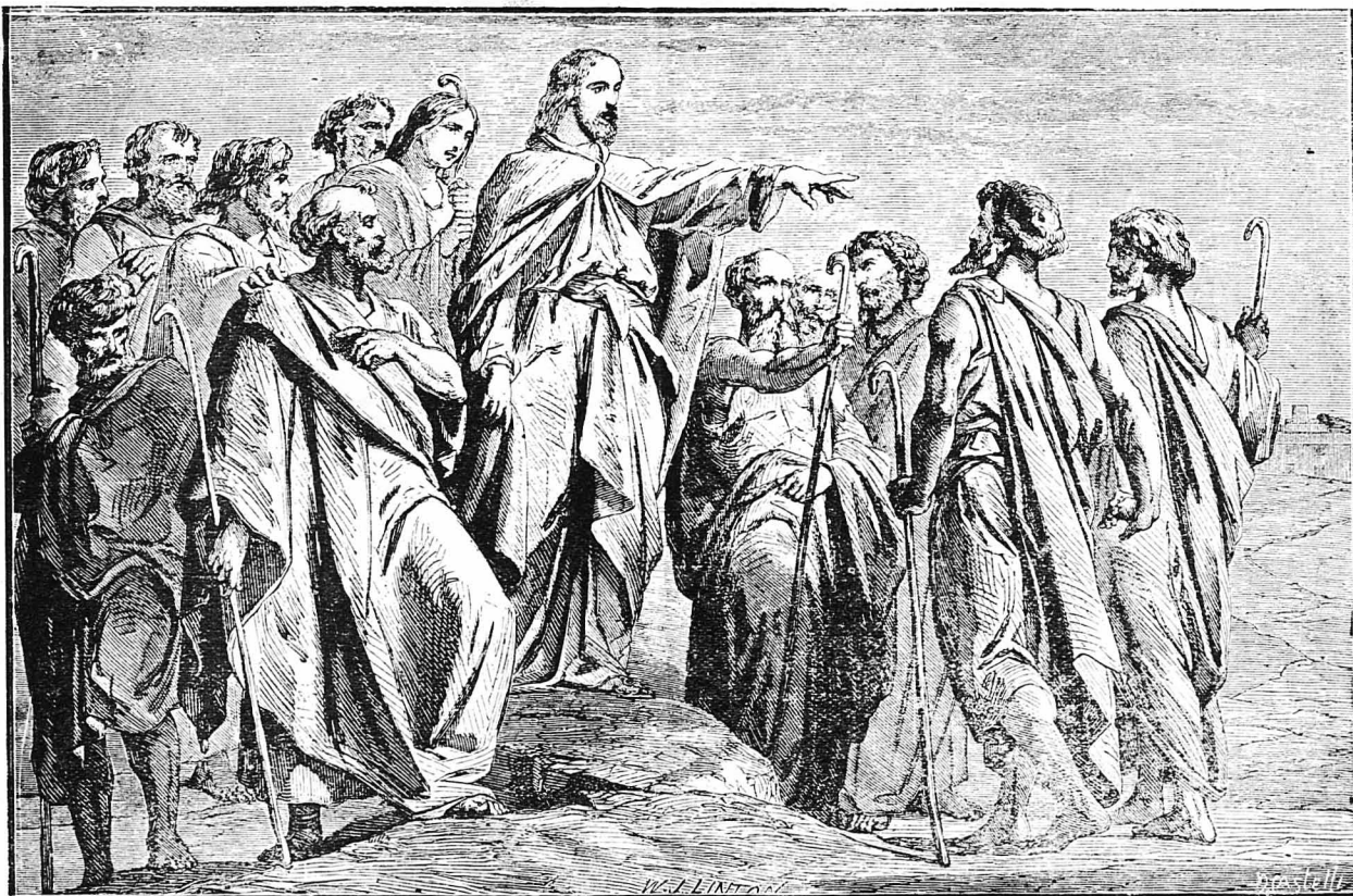
ΑΠ' ΤΗ ΖΩΗ ΤΟΥ ΧΡΙΣΤΟΥ. — 'Ο 'Ιησούς διδάσκων τούς Μαθητάς του.