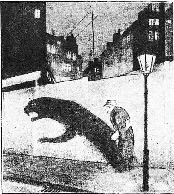
... Έβγαίνε κρυφά την νύχτα απ' το σπίτι του, για να διαπράξη τα άγριότερα έγκλήματα, ώθούμενος από το θηριώδες δεύτερο «έγώ» του!...