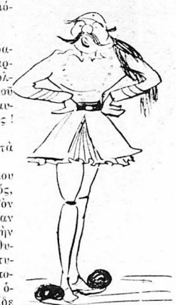
Νόμισα πως σάθηκε για να τον φωτογραφίσουν!