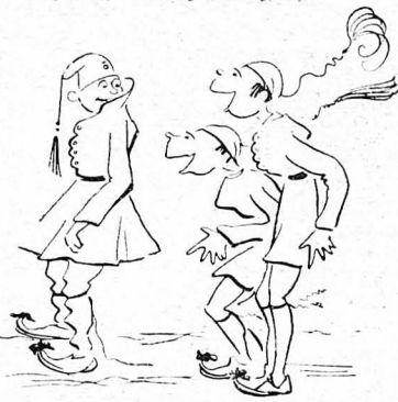
— "Αι ουρέ, μαντύας μιά φορού!...