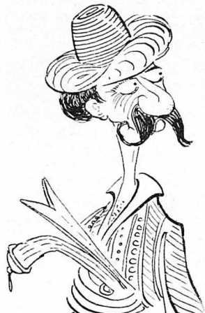
Σάν κανένας δεροβένιας των Γεννιτσάρων.