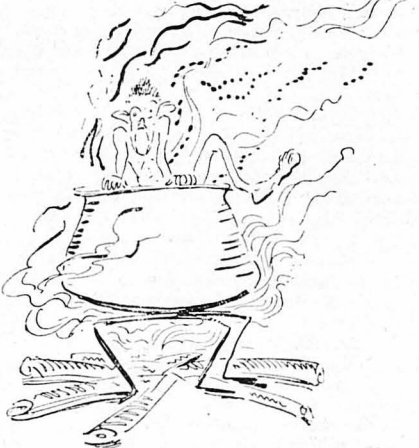
—Θά βράσετε στα καζάνια της Κολάσεως!...