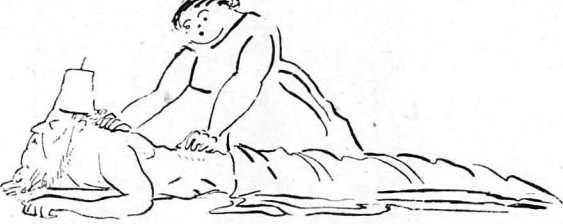
— Τους τριθουν!...