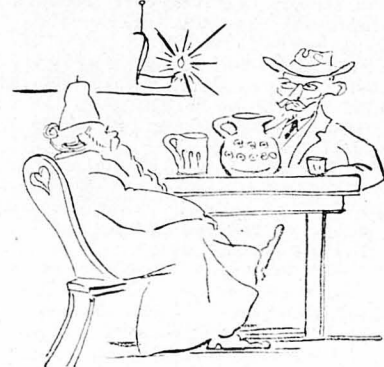
— "Γιτα κάνουμε εδώ; μου λέει ο πάτερ Γελάσιος.

Το μεγάλο ξύλινο τραπέζι του μοναστηριού στρώθηκε με τραπεζομάνηλα βαθού γαλάζιου χρώματος, με τετράγωνες λευκές γραμμές. 'Απάνω κι' απέναντι σε κάθε έναν από τους παρακαθημένους,