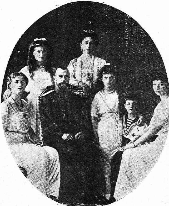
'Η αυτοκρατορική οικογένεια τῆς Ρωσίας.

Ἐκεῖνη τὴ στιγμῇ, ὁ ἅγιος βρισκόταν κλεισμένος στὸ δωμάτιο του μαζί μετὰ τὴν κόμισσα Βυρονζέφ. Ὁ Ρετσινικόφ καί ὁ Μαντόν-νίγιεφ, οἱ ὁποῖοι μόλις πρὸ ὀλίγου τοὺς εἶχαν ἀφήσει, εἶχαν μεταδώσει στὴς ἄλλες κυρίες μιὰ δυσάρεστη εἰδήσι. Ὁ Ρασπούτιν εἶχε ἀρνηθεῖ ἂν ἀντήση σὲ μιὰ τηλεφωνικὴ προσκλησι τῆς Αὐτοκρατείας καί εἶχε δηλώσει πὸς ἡ λειτουργία τῆς μετανοίας δὲν θά γινόταν, ἂν ἡ μάκα (ἔτσι ἀποκαλοῦσε τὴν Τσαρίνα), δὲν τὴν τιμοῦσε μετὰ τὴν παρουσία τῆς. Τοῦ κακοῦ τοῦ εἶχαν παραστήσει ὅλες τὴς δυσάρεστες συνέπειες πὸς ὑποροῦσε νά ἔχῃ ἡ ἀξίωσις του αὐτῆ. Τοῦ κακοῦ τοῦ εἶπαν πὸς ἦταν σχεδὸν ἀδύνατο νά βγῇ ἡ Τσαρίνα ἀπὸ τὰ ἀνάκτορα 'Αλεξάνδρας γιὰ νά πᾶ στὸ μεγάλο ἀνάκτορο, χωρὶς νά παρακολουθηθῇ καί ν' ἀναγνωρισθῇ. Τοῦ κακοῦ τοῦ εἶχαν μιλήσει γιὰ τὸ σκάνδαλο πὸς θά ἐπακολουθοῦσε καί τὴ μανία τοῦ Αὐτοκράτορος ἂν μάθαινε πὸς λειτουργίες καί λιτανεῖς, στὴς ὁποῖες δὲν εἶχε θελήσει ποτὲ νά πιστέψῃ, γίνοντουσαν σὲ δύο βημάτων ἀπόστα-