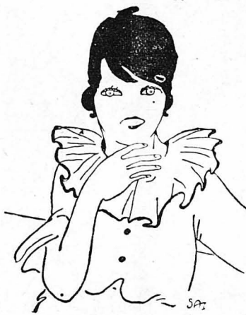
Μ' άκουγε κυττάζοντάς με στοχαστικιά...