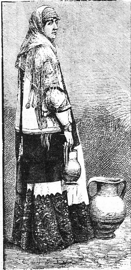
Νησιώτισσα. (Απὸ τὸ «Tour de Monde»)

Ὁ Λάνδερ δολοφονήθηκε στὶς ὄχθες τοῦ ποταμοῦ Νίγηρος.