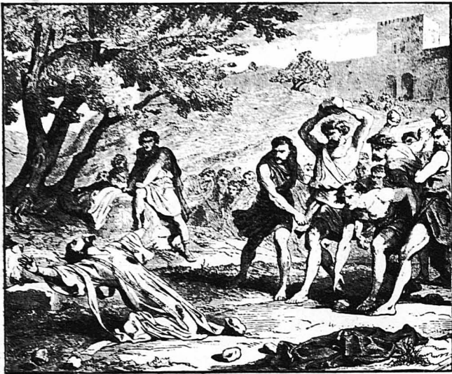
Ο λιθοβολισμός του Άγιου Στεφάνου. (Είκων από την Βίβλον)

— Άρχιστε σεις πρώτοι, φώναξε τότε άσπληρά ο Άχμέτ έφέντης