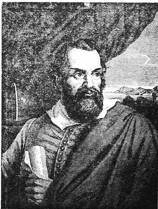
Ὁ διάσημος Ἰταλὸς σοφὸς Γαλιλαῖος. (Παλιὰ γραφοῦρα)