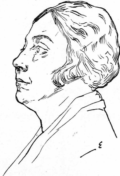
Ἡ κ. Μυρτιώτισσα.

—Ναί, τὸν βρῆκαν, τὸν βρῆκαν, φωνικά! Πῶς ἦταν δυνατὸν νὰ μὴν τὸν βροῦν! Ξαναεἶπε μελαγχολικά ὁ ἀνθρώπος μὲ τὰ χροματιστὰ γυαλιά. Ἀλλὰ πὼς τὸν βρῆκαν, δὲ ρωτᾶτε: τὸν βρῆκαν κρεμασμένο σ' ἕνα δέντρο... ΝΑΠ. ΛΑΠΛΩΤΗΣ