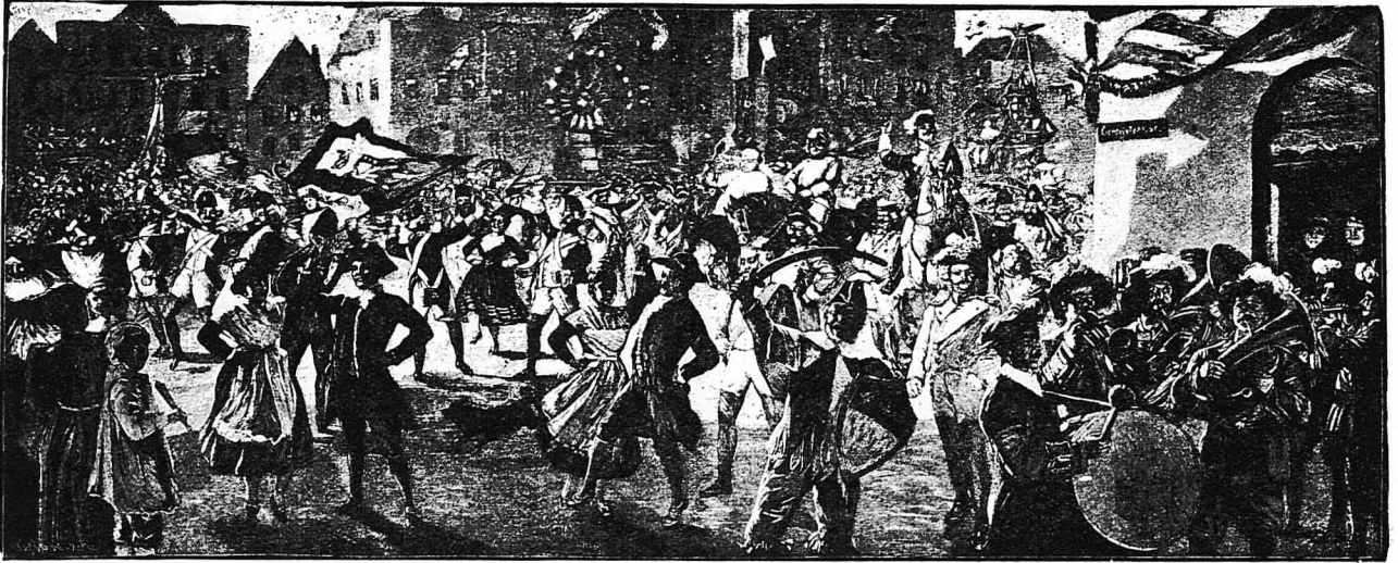
Η ΑΠΟΚΡΗΣ ΣΤΗ ΓΕΡΜΑΝΙΑ. — Το Καρναβάλι της Κολωνίας. 'Ο Χορός του Νυφοπέλαρου. (Εικόνα του ζωγράφου Χρ. Χέυδεν)