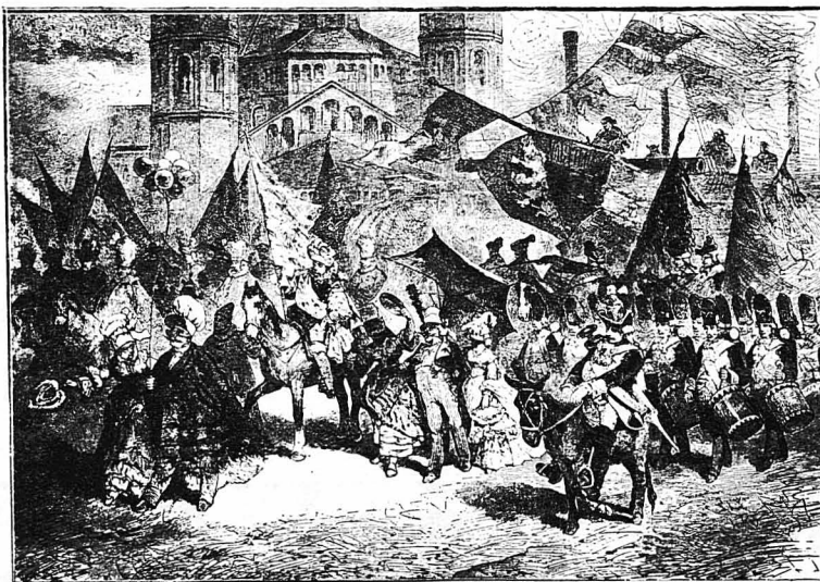
Το Καρναβάλι στην Κολωνία. Ή παρέλασις των νέων. (Εικόνα του Γ. Φράντζ)