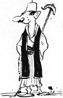
Ού Κότσιους ού Καρλίτσας.