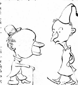
Γεμάτο Ριζίκους και Ριζίκες...