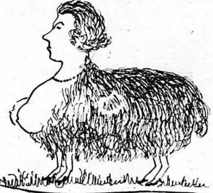
Μιά δίπους... προβατίνα προσετέθη στη στανή του.

Όταν ώδηγήθηκε ό μασκαράς στο τμήμα, άνεκαλύφθη ότι δέν έπρόκειτο διόλου περι μετεμφιεσμένου, αλλά περι άληθινού, πραγματικού βλαχοποιημένου, που κατέθηκε από τά μαντριά του, συννοδεύσας τά πρόβατα που έφερε για τις Αποκριές στην αγορά. Βλέποντας δε γένεια μακρύν και κατάμαυρά φώτα, τις ρεκλάμες και τις γυ-