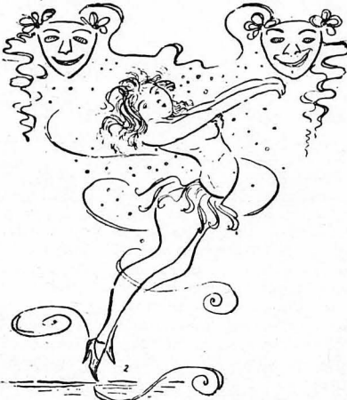
Μιά δθθεν Ζοζεφίνα Μπαίκερ...

Κι' δλ' αυτά σημαίνουν ότι κάποιος παραλής θά κριόβεται κάτω από τη βλάχικη την κάπτα του.