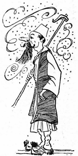
Φορούσε μιιά μεγάλη μύτη, με γένεια μακρύν και κατάμαυρά φώτα, τις ρεκλάμες και τις γυ-