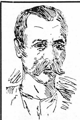
Ὁ καρταμυθηθεὶς στὸν Πύρ- γο κακούργος Ν. Κριτζί- νελης. (Σκίτσο τῆς ἐποχῆς)

Λίγα δευτερόλεπτα κατόπιν, ὁ δολο- φόνος τοῦ Ζαφειροπούλου δὲν ἴπτηξε στὴ ζοῆ. Ἡ μάγισσα τῆς λαμητόμου ἔπεσε βαρεῖα ἐπ' τῆς κεφαλῆς του πρὸς ἱκανοποίησι τῆς δικαιοσύνης καὶ τῆς κοινωνίας. (Ἀκολουθεῖ)