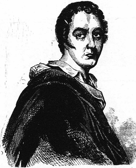
Ο Δόργος Βύρων. (Σπανία και άγνωστη εικών του του 1822)

Όταν τελείωσε η τελετή στην εκκλησία και βγήκε ο βασιλεύς κι' ανέθηκε στο άλογο του, ο Βενετός πρόξενος έτρεξε κι' έπιασε το δεξί γαλιναίο του άλόγου του. Αυτό ήταν η μεγαλύτερη τιμή που μπορούσε να γίνει σ' έναν πρόξενο. Μά όταν κάλεσαν τον πρόξενο της Γενόβας να