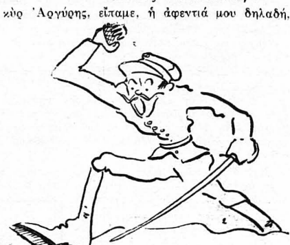
— Άλτ! γιατί σ' ός έφαγα, Άρκουδιάρεοι!