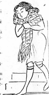
Κατέθηκε μισόγυμη, με τις κάλτσες...