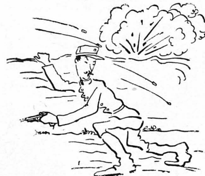
— Βρέ Γιάννη, λάβε τα μέτρα σου, γιατί έσένα φωνάζουν τα βόλια...