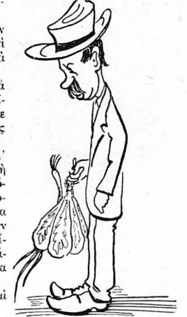
Οι νοικοκυρέοι άρχισαν να περνούν με τ' άπογε- υματινά τους φώνια...