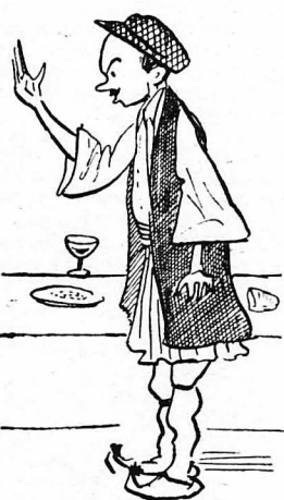
Αντεφώνησε ο πρόεδρος του χωριού.

— Δεν πρέπει να φύγουμε, έλε. Άλλά κι' αυτά τά τοιμτοίρια, ούτε με την πένητα, ούτε με την πολιτική, ούτε με αναφορές θα ξεκολήσουνε από το χωριό μας!... Μ' ένα μονάχα τρόπο θα τους διώξουμε. Με την «γαλατσιδά». Οι άλλοι τον κυττάξανε;