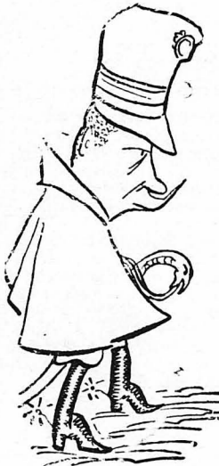
Ο Κολονέλος ανέβαινε στο φρούριο κάθε πρωί κι ι μεσημέρι...