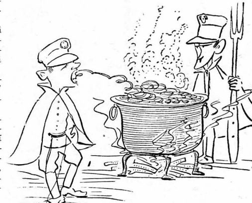
Και φλουπ! το μακαρόνι γλιστρούσε στο λαγύγγι τους...