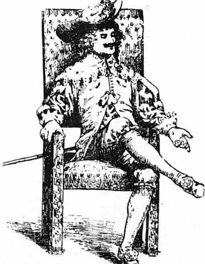
Ένω ο Βασιλεύς συνομιλούσε με τον ναύαρχο Κολινά...