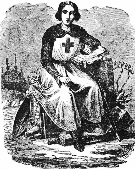
Η 'Ιωάννα ντ' Αρκ.

Άλλ' όταν έφτασε εκεί, οι φύλακέσ της της έβγαλαν τα γυναικεία ρούχα και την έντυσαν πάλι με άντρικά. Τουσ κάκου διαμαρτυρήθηκε ή δυστυχισμένη λέγοντάσ τουσ δι την είχα άνειλήσει με θάνατο ό δι δικασταί της σε περίπτωσι που δέν θά τηρούσε την ύπόσχεσι της.