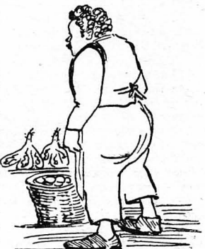
— Ό μπακάλης τόν κώπταξε περιεργά...