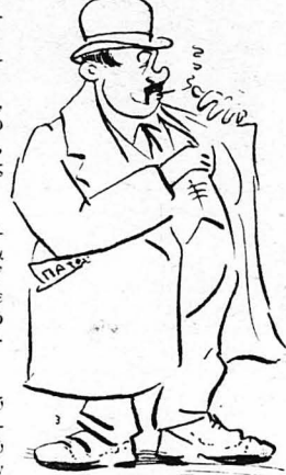
— Όταν έβαλε τó χέρι του στήν τσέπη...

Στη Χίο λένε πώς βρισκόταν ένα πηγάδι πολύ βαθύ, στό όποιο μένει ένας άνθρωπος πού ονομάζεται Βένιας. Ό Βένιας αυτός, άμα φτάσουν τά μεσάνυχτα, άφνει την κατοικία του και καθελικεύοντας ένα άλογο αρχίζει νά καλπάζη και νά πλανιέται μεσ' στή νύχτα. Όταν κουραστεί από τó τρέξιμο, ξαναγυρίζει και σιγχετα πάλι στό πηγάδι. Όποιος λοιπόν πει άπ' τó νερό του πηγαδιού έκεινη τή στιγμή, χάνει τά λογικά του και γίνεται λωλός. Γι' αυτό, άμα θέλουν στη Χίο νά πούν κανέναν λωλό, τόν λέν πώς ήπιε άπ' τó πηγάδι του Βένιας.