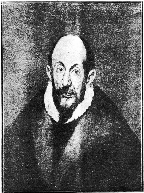
Ο Έλλην ζωγράφος Δομένικος Θεοτοκόπουλος (Γκρέκο) (Αύτοπροσωπογραφία)