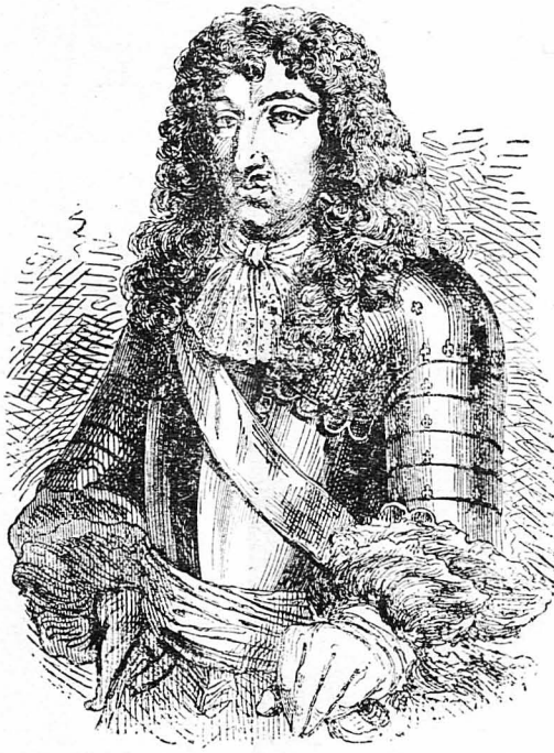
Ὁ Λουδοβίκος 14ος.