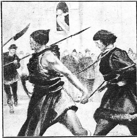
Μπροστά βάδιζε ο δήμιος κρατώντας το σχοινί της κορμάλας, περασμένο στο λαϊμό του νέου...

Οι καλύτεροι γιατροί της Φλωρεντίας, τους όποιους φώναξε η οικογένειά του, δεν μπόρεσαν να βρουν την αίτια της άρρωστειας του και ούτε τα φάρμακα που του έδιναν του έκαναν κανένα καλό. 'Η μητέρα όμως του νέου διασιβάνηκε από τι υπέφερε το παιδί της. Κι' ένα βράδυ, που ήταν μόνοι οι δύο τους στην κάμαρά του, τον άνάγκασε να της φανερώση τι ήταν έκείνο που τον έκανε να μαραινάεται και να λυώνη, δηλαδή την άγάπη του για την όμοια Διάνα ντε Μπάφντι, άπ' την όποια το μίσος των δύο οικογενείων τον έχώριξε άμειλίχτα.