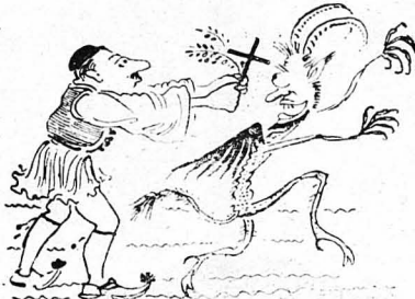
— 'Από την «κοντοάγρα» τα γλυτώνω με τον άγιασμό...

— Άν θέλετε να γιαιρευτήτε από τον έρωτα, ν' άποφραγείτε τους έρωτευμένους. 'Ο βίδιος. —Τα κακά που μās έπροξένησαν ή γυναίκες, προέρχονται από μās. Τα καλά όμως που μās προξενούν, προέρχονται άπ' αυτές. Μαρτέν. —'Ο θάνατος στη μάχη εινε ένας ύπνος αντίξιος των άνδρείων. Σοφοκλής. —'Ο έρως εινε άνιγμη. Λύσις του εινε τό μήσος. Σόη.