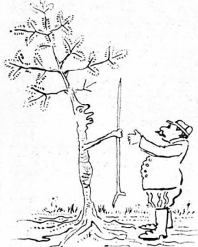
'Ελατα, δώστε μου σουβλιιά!

Φανταστήτε πειά τη χαρά του Γιάννη του 'Απήγανου, όταν είδε τον παπιά να διαβάει μεγαλοφώνως, και όλο το πλήρωμα του ναού να σταυροκοπιέται, σαν να παρακαλούσε κι αυτό για τα πρόβατά του και τα γίδια του: