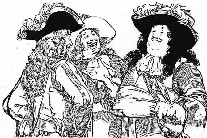
Οι άκόλουθοι του 'Ιπτότου με τόν μαύρο μανδύα άστενειόντουσαν μεταξύ τους...