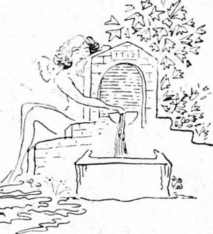
Όλα τὰ νερά εκείνη την ημέρα γιόρταζαν...

Άνεμοι κατακάστετε και σεις βουές, για πάφτε, γιατί περνάει ό «καχαγιάς», τὸ πρώτο «τσελιγκάτο», χτυπούνε τὰ κουνούδια τους, σαν μόρα του Γενάρη, βελάζουν ή «προτινές» του σαν θάλασσας φουρούνα, τσουγκριόνται τὰ κριάρια του, σαν να φουούν άνεμοι, και τὰ μικρά τὰ πρόβατα, σαν κύματα πηδάνε. Άνεμοι κατακάστετε και σεις βουές, για πάφτε, Κατακογιάννης πάει μπροστά, μ' έφτά χιλιάδες «πράττα».