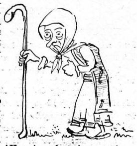
Ό πιο παλαιή γηρούλα, βαρή και πατριή των άγιων την πα-

Καιρό ελχε να κατεβή στη χώρα ό Άπύγανος και χρονια να μη σ' έκκλησιά. Έτσι, μέσα στο ήμφορ τού ναού, που ήταν γεμάτος από κόσμο, στον παπάδων τις χωρές στολές και στού Δεσποτή την όλόλαμπε, στη σο-