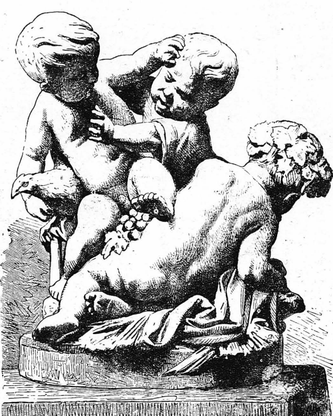
Ο ΚΑΥΓΑΣ (Τοῦ Μπερνελέ)