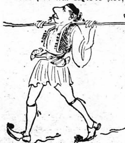
Έδιάβαινε ό Γιάννης ό Άπύγανος...