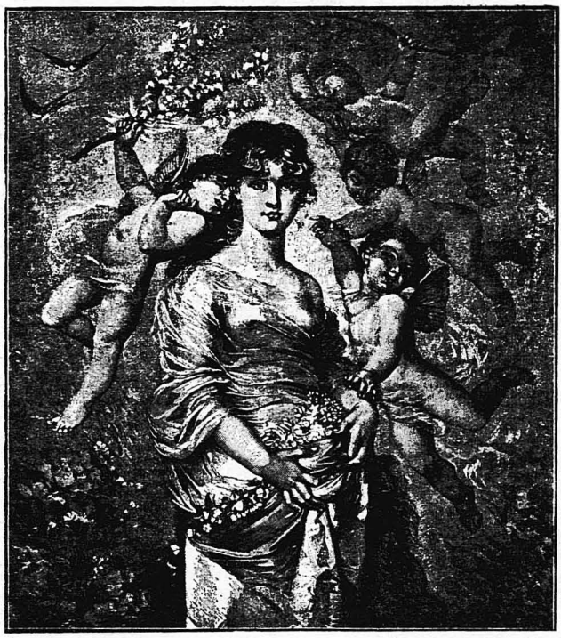
ΑΝΘΙΣΜΕΝΕΣ ΑΜΥΓΔΑΛΙΕΣ (Τὸ Κ. Βοαλλεμό)