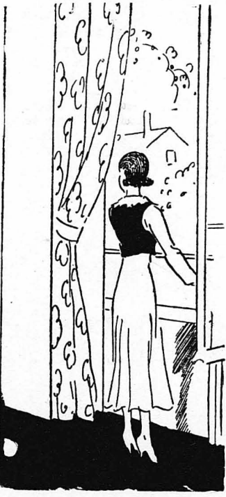
Νά πάη στο παράθυρό της και να στείλη τόν ίσκιο της πλάι στον δικό του...

—'Η καλή γυναίκα, λέγει ο 'Αγ. Γερώνιμος, είνε ένα μυθικό πουλί.