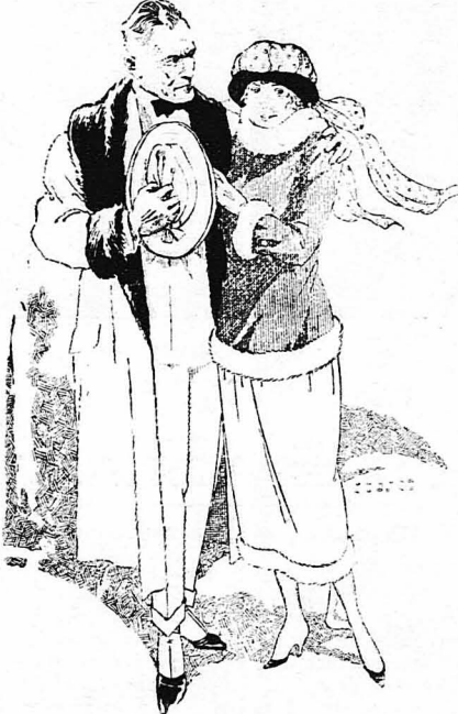
Ἀρχίσμα νὰ προχωροῦμε ὁ ἕνας σιμὰ στὸν ἄλλο...