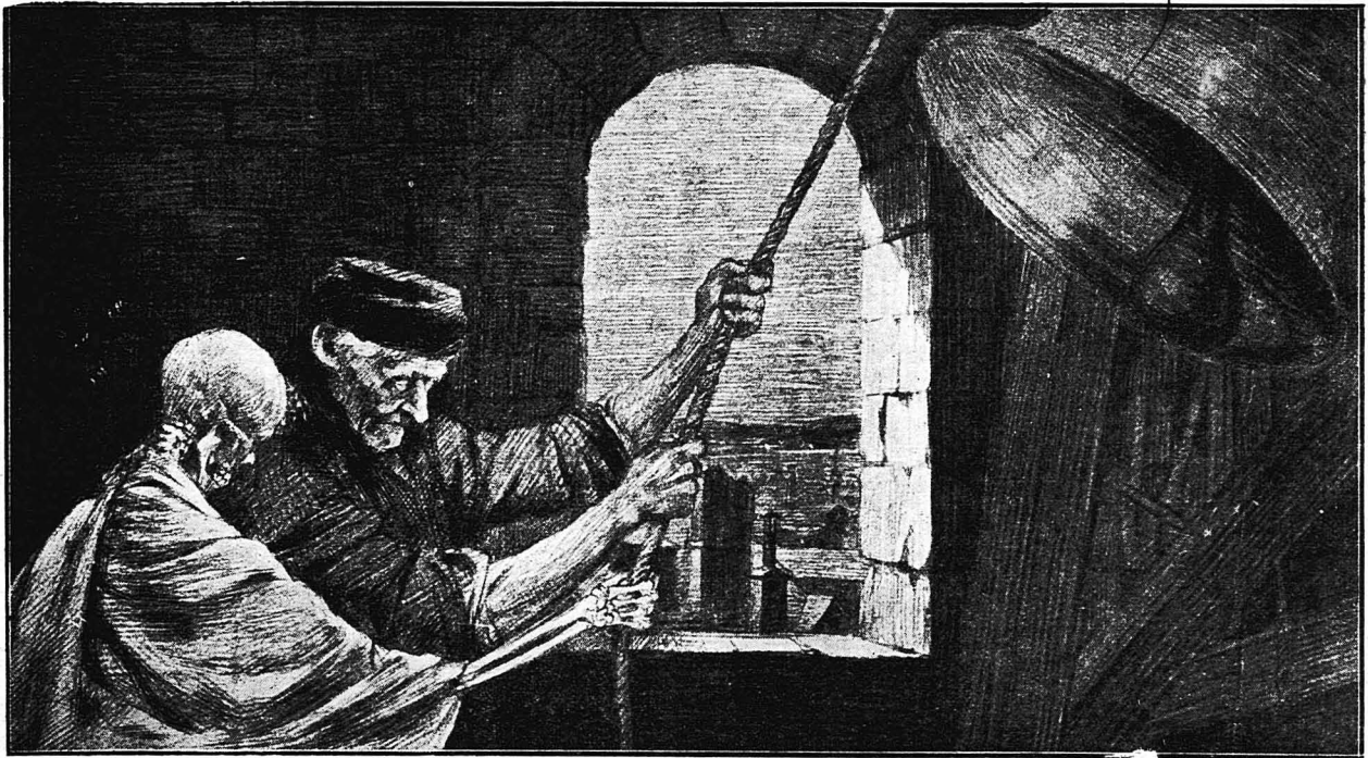
Η ΣΤΕΡΝΗ ΚΩΔΩΝΟΚΡΟΥΣΙΑ