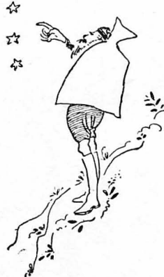
Νά τό δικό μας τό ρολόι.

«Σταμνάγκαθα» μονάχα με τά γαλάζια τους λουλούδια (άγρια, άγκαθωτά ραδικια) κ' ένα άλλο χορταράκι, που σάν φοβισμένο κρυβόταν στα κωλώματα των βράχων και ήταν