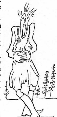
Καλό γιά τά ρίγη τού πυρετού και τό στομάχι.