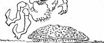
'Η φοβερός «κντοούκλες»!...

— Ναι, έτσι είνε. Δέν πρέπει νάναί τά κλωσοπούλια μονομηνίτικα και μονοφεγγαρίτικα, γιάτί δέν ζούνε.