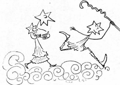
Και πίσω άκολουθεί ή Κερά με τό παιδί στην άγκαλιά της.

Γκερμοί και κακοποιές. Γλύστερες πλακερές, άπάνω στις όποιες τροχιάντουσαν και σπίζιζαν τά πέταλα των άλόγων, μ' έναν ήχο που σου έφερνε άνατριχίλα και νόμιζες πώς τώρα θά κατακυλίση, άναβάτης κ' άλογο, στο σκοτεινό τό χάος.