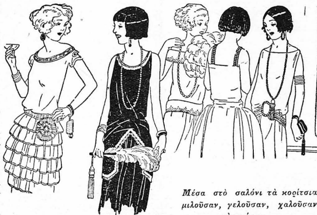
Μέσα στο σαλόνι τά κορίτσια μιλούσαν, γελούσαν, χαλούσαν τόν κόσμο....

Μιά τετράριπλη πόρτα, άνοι—χτή πάντα, ένοιουε την τραπέζια με τό σαλόνι. Και στο σαλόνι προ—νούσαν τή βραδιά τους κοιτσιπο—λεύοντας μερικές συγγένσες ή φιληράδες τής Κανούταντας, δυό ζαδέφρες της, ή γυναίκα του παν—τρεμένου άξιοματιζού κι' ό δυό ά—δορφάδες του άνύπαντρου. Αιτές ήταν οι ταχικές. Μά κάπου—κά—που πήγαιναν κι' έκτακτες. Παρα—δείγματος χάριν ή κυρία Γιαννο—