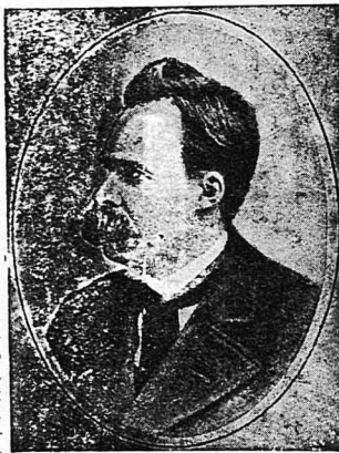
Ὁ Φρειδερίκος Νίτσε.

Καὶ τὸ αἰσθημα φαίνεται αὐτὸ πὸς σκοπίστηκε καὶ στὸ ἔργο μου, χωρὶς ἐγὼ νὰ τὸ θέλω, μέσα στὰ ἄλλα ἠγορηκὰ καὶ φουσκωμέ- να λόγια ἄλλης τῆς ξένης Νίταϊ-