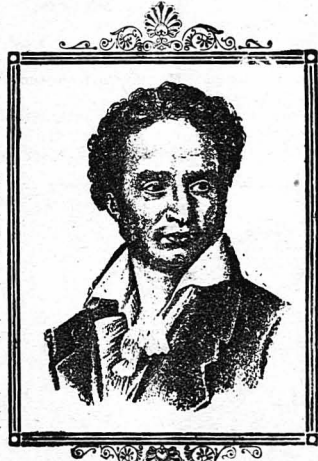
Ὁ Οὔγιος Φώσκολος.

Σ' ἐμένα ἡ μοῖρα μοῦ ἔγρασαν ἀδάμαστη ταρῆ. Μετ. Σ. ΜΑΡΤΩΚΗ