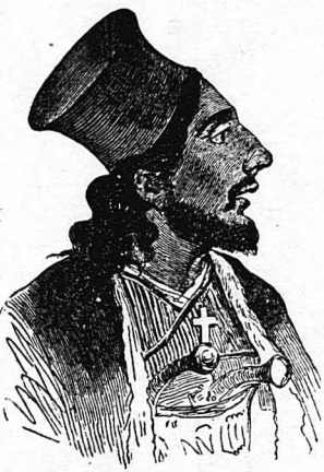
Ὁ Ἀθανάσιος Διάκος, ἕνας ἀπὸ τοὺς πῶ ἡρωϊκοὺς κληρικοὺς τοῦ 21.

«Ἄκουσε, Μεγαλειότατε! Ἀπὸ τὴν ἀρχὴ τοῦ ἀποκλεισμοῦ στὸ Μεσολόγγι, ὁ παπᾶς ἀντὶς, ἡ μὴν δούλειά ποῦ ἔκανε, ἦτανε καθὼς ἐπιάνετο τὸ τὸν ῥόκνι — καὶ ἦταν ἀπὸ καθημερινὸ — εἶνε μέρα ἦτανε, εἶτε νύχτα, ἔτρεχε στὴν ἐκκλησιά, ἔπαιρνε τὸ δυσκοπότερο στὰ χέρια του καὶ ξεσκονοφότος, μὲ τὰ φανάρια του, ἐπήγαινε ἀπὸ τάμπια με τὰμπια καὶ μεταλάβαινε τοὺς βαριά πληγωμένους καὶ τοὺς παρηγοροῦσε μὲ καλά λόγια καὶ ἐγκαρδιῶνε τοὺς ἄλλους νὰ πολεμοῦν μὲ ὄρεξι καὶ μὲ ψυχῆ, γιὰ νὰ ἔχουν τὴ βοήθειά τοῦ Θεοῦ. Σὺν ὁμοῖζομαι στὴν πίστι μου, Μεγαλειότατε, ὅτι δὲν πέρασε ἡμέρα, εἶτε νύχτα, νὰ μὴν τὸν ἰδῶ στὴν τάμπια μου, ἀπάνω στὸ τσοφτεκι, καθὼς καὶ νὰ φέρη γυὰ ὄλες τίς ἄλλες τάμπιας, καὶ μέσα στὴ χώρα ἀπὸ σπίτι εἰς σπίτι. Καὶ σὺν γυροῦσθαι τῆς Ἐξέδου ἦτανε μαζί μας καὶ βόλι ἡ μπαλά δὲν τὸν πείραξε. Τότε δὲν εἶνε ἅγιος ὁ παπᾶς αὐτός;»