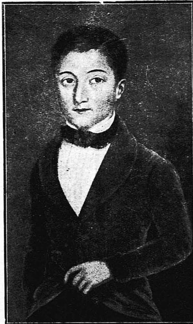
Ο Γάλλος συγγραφέας Γουλιός Κλαρετί, σέ ήλικία 12 ετών.