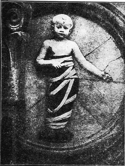
Ὁ Μικρὸς Χριστὸς. (Τοῦ Ἀντρέα νιέ λα Ρόμιο)