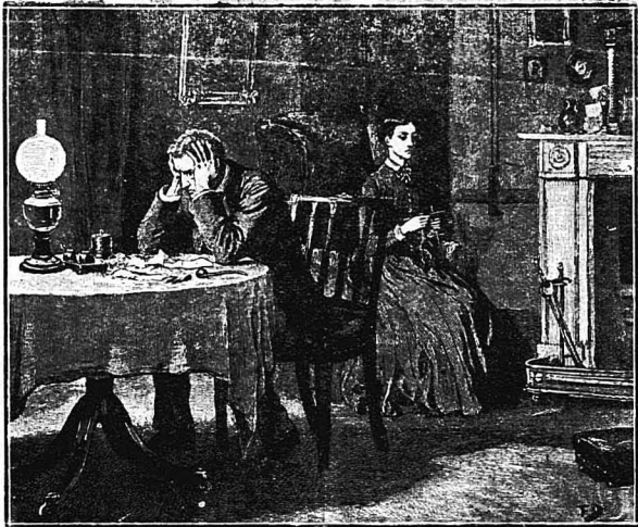
Κάθισε σε μιά καρέκλα κι έσφιξε το κεφάλι του ανάμεσα στα χέρια του...