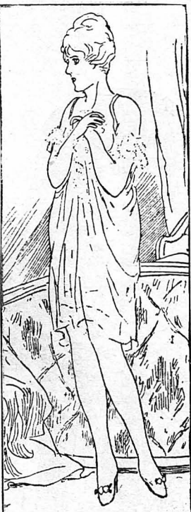
Η θεατρίνα γύρισε και τόν κύνταξε ξαφνιασμένη.

— Βρε ξεκοτούσσο, Νικολή, και χαλάλι σου τά βρεσέδα!... ΣΤΑΜ. ΣΤΑΜ.