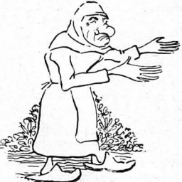
—'Υπουονή, ύπουονή, τούς έλεγε πάντα ή Νικόλινα.

— Νικόλη μου, τί θά γίνουμε;... 'Ο Νικόλης έγιορσε, τήν κίτταζε στή μάτια. Προμένη, γρατσινω- μένη, άναμαλλιάρα και έλεινε, με κόκκινα από τή κλάμμα τή μάτια και τή μάγουλά της καταβρεγμένα