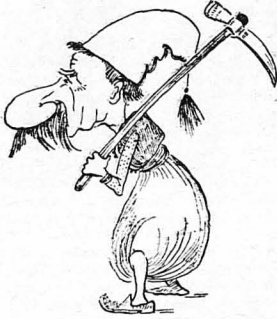
Γυρίζοντας κατακουρασμένος από τους άγρους...