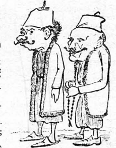
Χρωστόσε σε δυό 'Αρμ- ηδες πού γύριζαν στο δρόμο...