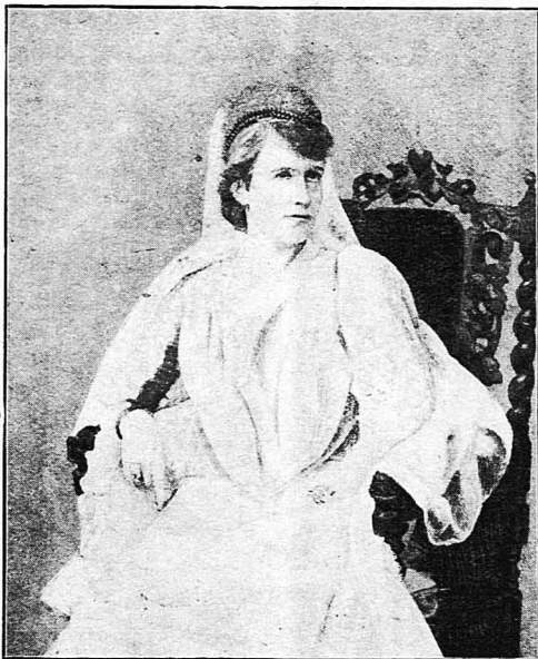
Η συγγραφέυς του διαλόγου Βασίλισσα της Ρουμανίας Κάμεν Σύλβα.

κεσ τόν φοιτητών, ξέσπασε στην "Ηπειρο και σπή Μακεδονία. Πολλά από τά παιδιά αυτά σκοτώθηκαν εκεί πάνω. Βρήκαν την άπεράνητη ερήνη, που ή άνήσυχη ψυχή τους ζητούσε για ν' αναπαυτή, άφού έξελλήρωσαν έναν προορισμό και είδαν πραγματοποιούμενα τά δνειρά τους. "Όσοι έπιζών και θυμούνται περισσότερα για την περίοδο εκείνη της «Ενώσεωσ», άς συμπληρώσουν τά παρόντα, τά όποια έλέχουν και λέξιν μνημοσύνη, για δέντας από τούσ νεανικούς συντρόφους μας έκείνουσ χάθηκαν, και έπαναφωρέσ σε μία παλιά και άμορφη ζωή, για δούσεσ ζύνε... ΣΤΑΜ. ΣΤΑΜ.