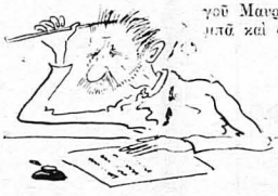
Κρατούσε τά πρακτικά έννας ισόβιος φοιτητής...