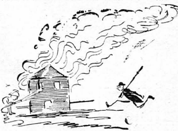
Έτρεξε εκει για να ζεσταθί !...

Και μετά έφειναν και διαδικασίαν ήμερών ολοκλήρων, ή άπόφασις έξεδόθη, άπαλλάσσουσα μέν τόν κατηγορούμενο, έλλείψει έπαρκών και έπί-