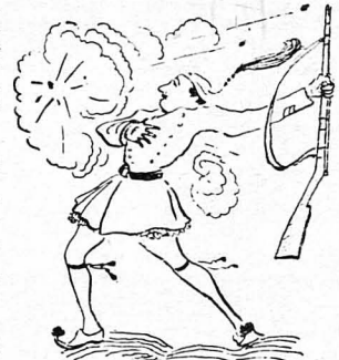
Τό αίμα πύδβραζε στις φλέδες των φοιτητών έξάσπασε στην Έπειρο και στη Μακεδονία...

Έφρασε όμως ένταχώς τό 1912 και δη έκείνη ή νεανική όρμη και τό θερμό τό αίμα πού έβραζε στις φλέ-