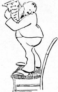
Απήγγελλε κατηγορητήριο κατά του προέδρου!

Όπως έλεγαν και στο προηγούμενο φύλλο, μετά την επανάσταση του Γουδι, η «Φοιτητική Ένωσις» άρχισε να γιγαντώνεται. Ο νέος πρωθυπουργός, μόλις ανέλαβε την προεδρεία, δέν άπηξίωσε να συνεννοηθή και με την «Ένωσις» δι' αντιπροσώπου του. Στο συνέλευση της 14 Σεπτεμβρίου, ιδιαίτερα έντύπωση έκανε έπισης η παρέλασις 500 φοιτητών. Είχαν προσχωρήσει πάλι όλοι στην επανάστασι, φωτισθέντες, καθώς έλεγαν, εκ των ιστέρων, ίσω απο την... επανόρθωσι της επανάστασεως. Στο συνέλευση το φοιτητά έβόδιζαν κατά τεράστας, με ενθουσιαστικά παραστήματα, τη σημαία τους έμποδαν και κανόνιας στην ζωοβοδοχή.