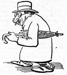
Οι «Επιχορονοί» ήσαν αγαθοί όμογενειότατοι...