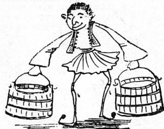
Συνελήφθη ένας γαλατάς... ως κατασκοπος!...

Νυχτοφύλακες, νυχτοσκοποί, διπλοσκοποί, έφοδοι, προφυλακές και κατοπτρεύσεις. Τα σκοτεινά άτομα και η κατάνιανος στρατιές, ανηχούσαν απο παραγγέλιματα και φράσεις στρατιωτικώς. Οι εκεί φιλάζοντες αλιότες των Αθηνών και τα μικρά παιδία, τα ρακένδιντα, που ποιοίσαν λαζαει στους δρόμους, αναστατώθηκαν χωριστικώς. Μεγάλονοταν καθώς βράδι... Βλαστημιόταν και διέστρεφαν, λεγολοφώνοντες και όβριστησις, καθώς στρατιωτικά παραγγέλιμα που άκουγαν, κι έφραγαν, σαν να τα κινήγοσαν διαδόλοι, ζητώντας άλλου άσιου.