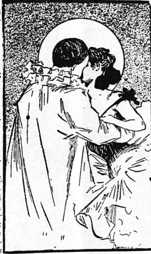
Τὸ Φίλημα τῆς Ἀποκηρῆς

Τῆς μάνισσα τὴν ξανθοῦ-καὶ δαῦτη μὲ μανιῆλι λα, ὄλους ξεπροβοῦδι. τῆς μάνισσα πῆς σουρο-Τὸ ξεπροβοῦδι τῆς (ποτὰ) στάθηκα νὰ μανισῶς ποῦ γιοῦντοῦνται στὴ θαρ-ὡποῦν υπερεινὴ μάρκος (κοῦλα) μὸ ξέκομο κι' αὐτὰ. γιὰ πούλεμα στὴν ξενη-Ταχὰ τὸ ταχύνει (τεύδι) δι' σκάμπαζα νὰ πῶ Ἐτοῦθ' ὄλων' ὁ ἀγέρας γιὰ τὸν πελάγον ἀφροῦ. ὄλοσπαρα πανιά Ντοῦμα πανί, νηνιῆλι ντάλε κουάλε περιστέρια ἀράνι' τὸ νερί, ἐπαλιώνοντας φτερά, δάκρυσαν τὰ θλαυάκια Στένοντα τὰ θλαυάκια κι' ἀνάγια κι' ἀπαντός!