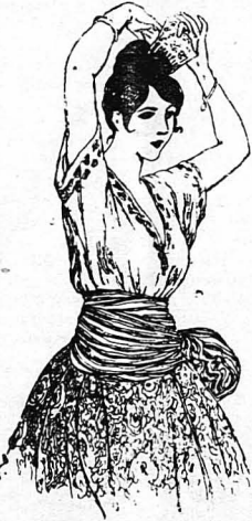
— Εἶν' ὑπέροχη ὡς Ἰσπανιόλα!...