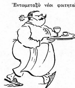
Μιά μέρα ό καφετζής καθός μούφερεν την μούρη άμαρτία των καφερειών...