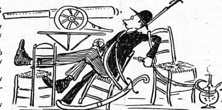
Πάνολος ή Πανεπιστημιακή νεότης !