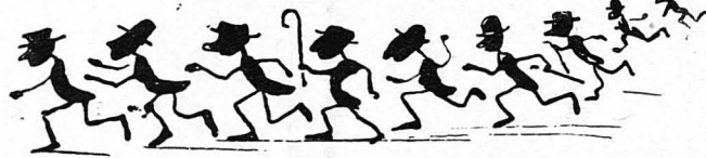
Πλείστοι φοιτηταί προσήρχοντο.

Άπό της στιγμής εκείνης, λίγες μέρες από της