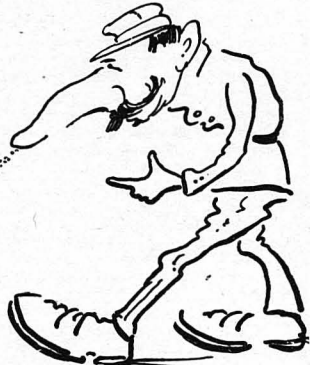
Η άστυνομία είχε μυστεί τά πράγματα...

Η προσέλευσις του Ζουλούμη και άλλων ζωηρών στοιχείων ήταν έπιθημητή βέβαια στην «Ένωσις». Προέκυψε όμως ένα ζήτημα. Άν ένεγράφοντο αυτοί, ή Ένωσις έ-