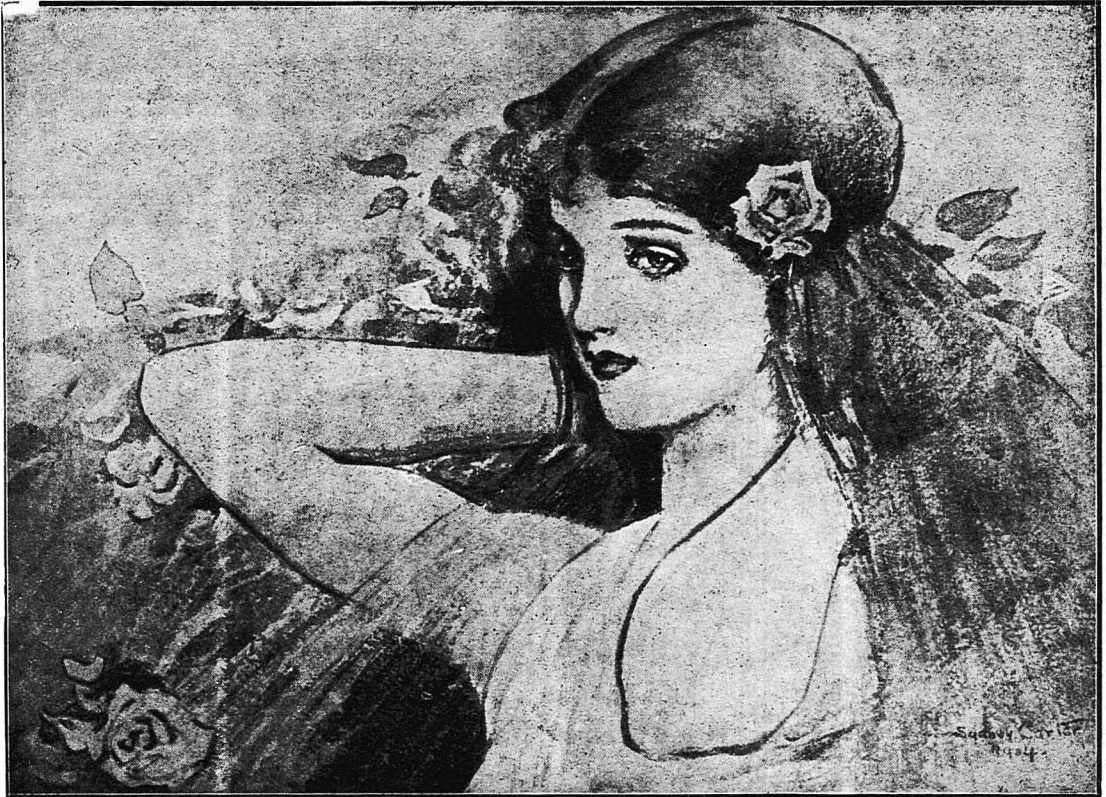
ΜΕΣΑ ΣΤΑ ΛΟΥΔΟΥΔΙΑ