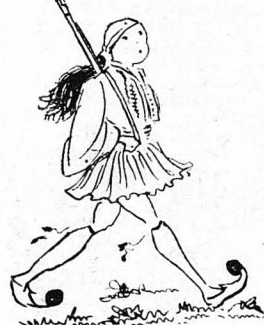
Σκερέμασε τὸ τουφεκί του καὶ ροβόλησε κατὰ ἔξω...

Κατὰνε φοπιέζε κι' ἔβγαζε μέτρα καὶ ὄργιες κορδέλλες κόκκινες καὶ ροσάνες ἀπὸ τὰ στόμα του, ὡν γάβγαζε τ' ἀντέρω του!... Τὰ παιδάκια τὸν βλέπανε καὶ γάσκανε.