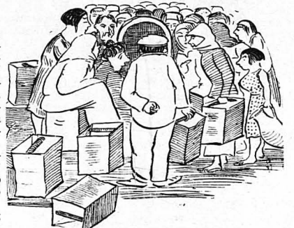
Κόμος καὶ κοσμῆζε...

Σανακοιμήθηκαν ἀγγελλὰ. Ἀζαγνα ὁ Περὰδωθεσε ξαναβῆνθησε... Κάτι οὐροῦντονε κοντὰ του. Ἦταν ὁ Μπαταριάς ποῦ ξανακίλησε καὶ πάλι πρὸς