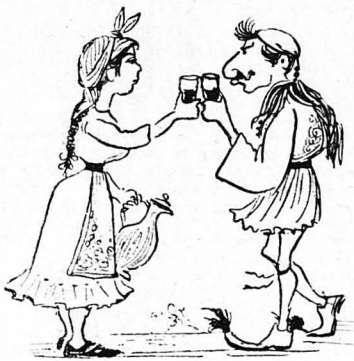
— 'Ιδέα, κουμπάρουλα μ'! ...

Καθ' ὅλη τὴ διάρκεια τοῦ τραπέζιού ὁ ἐπιλοχίας κίτταξε τὴ γυναίκα τοῦ Περὰδωθε καὶ τὸν ἔβλεπε καὶ τὸν ἐμίρανε ὁ καϊνός.