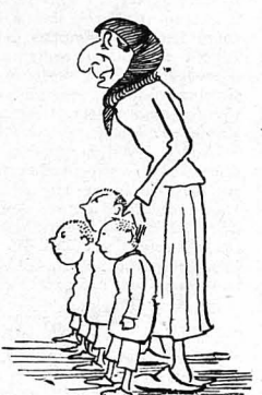
Τὰ παιδάκια τὸν βλέπανε καὶ γάσκανε...