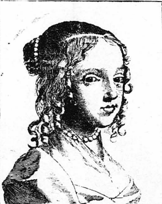
Η Μαρία Δουλιόβνα (Γραβούρα της εποχής)