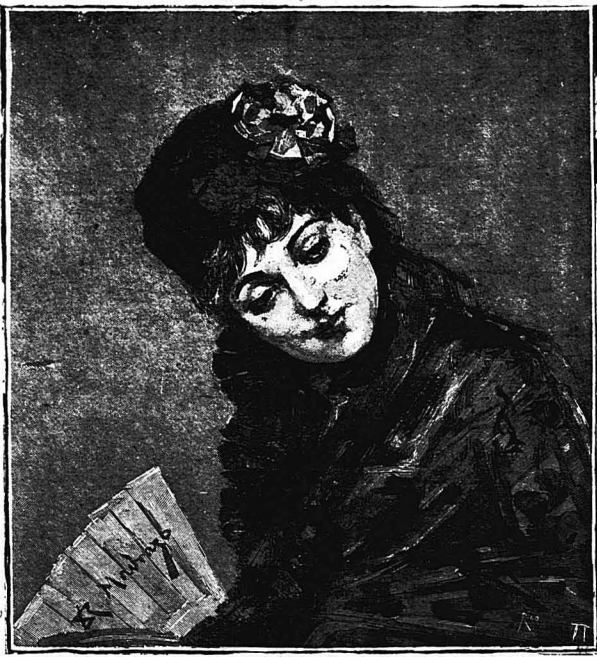
Σπανιόλα (Τού Μοντράζο)

"Ο βασιλεύς όμως, ό όποιος είχε ικανούς γιαιτρούς και μω-