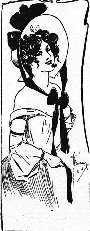
Η Φλόρα, ωραία, γοητευτική, αλλά κι' άκαρδη...

Η άμοιρη μητέρα της Λίτας, που πάλευε μεταξύ ζωής και θανάτου κι' ο αειώς δλης αυτής της συμφορας, ο υπεύθυνος για δλη αυτή την τραγωδία, ο Γιώργος Βρανάς.